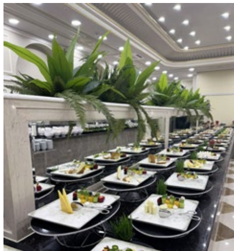
KULINARIK-KNÜLLER: Von traditionell bis modern und mediterran werden alle Geschmäcker bedient.