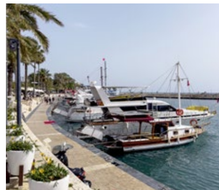
AUSFLUGSZIEL: Der historische Hafen des antiken Kleinods Side ist vom Ali Bey Resort Sorgun nur einen kurzen Strandspaziergang entfernt.