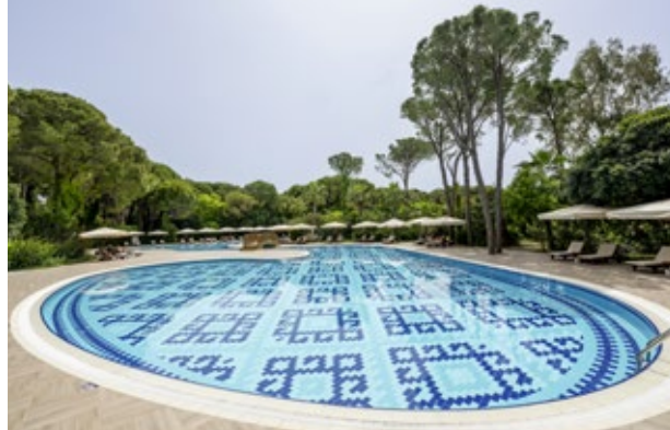
POOL-POSITION: Die Wasser-Landschaften der beiden Hotelanlagen laden zum Erfrischen und Entspannen ein.

Daher ist es kein Wunder, dass der Tennis-Weltverband ITF regelmäßig zu Gast ist. So finden 2025 im Ali Bey Club Manav-