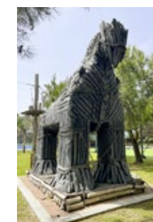
ECHTER HINGUCKER: Nachbau des Trojanischen Pferdes in Manavgat.